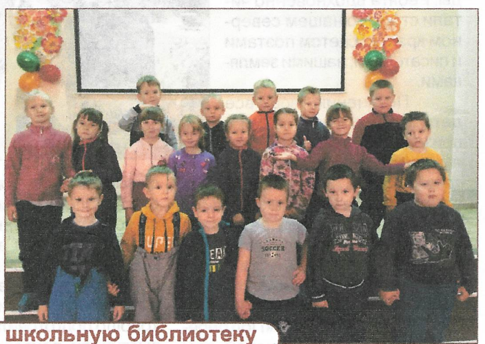
Экскурсия в школьную библиотеку

Учредитель: МБДОУ «Детский сад « Улыбка». Над номером работали: Котцова Александра Викторовна. Телефон для справок: 9-24-46.