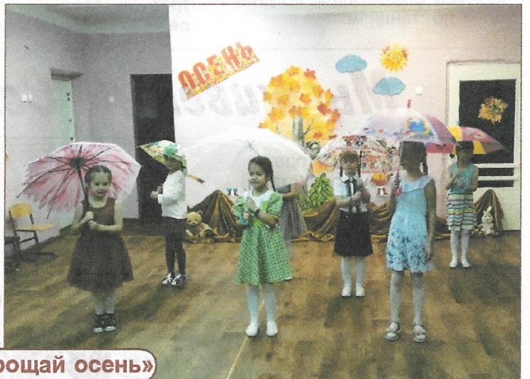
Праздник «Прощай осень»